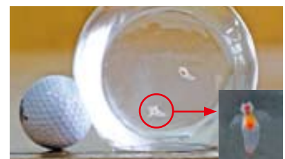
▲氷の妖精を間近で見ることができます

光を当てると幻想的な雰囲気に見えるクリオネをご覧になりたい方は、事務局までお越しください。