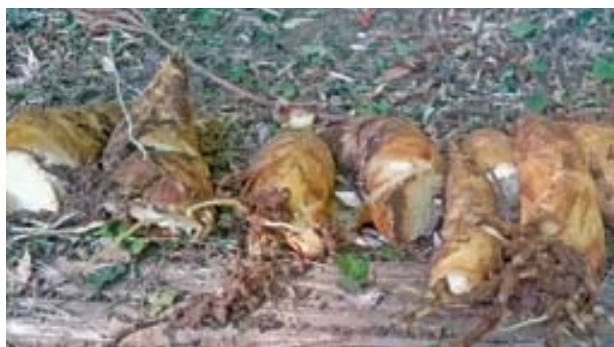
▲春を感じるタケノコ掘りにぜひお越しください