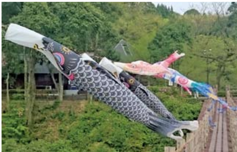
▲龍神橋に泳ぐ鯉のぼり