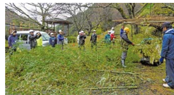
▲チップパーシュレッダーで竹を粉碎