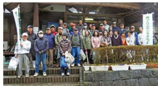
▲様々な年代の人が興味を持ち参加されました

今回の取り組みを通じて、自然に接する機会の無い都会の人達が、この機会に自然に接し、里山の整備や竹林対策への関心が高まることを期待したいものです。