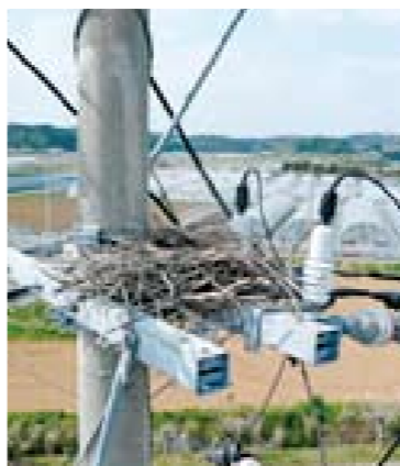
▲発見された場合はご連絡ください