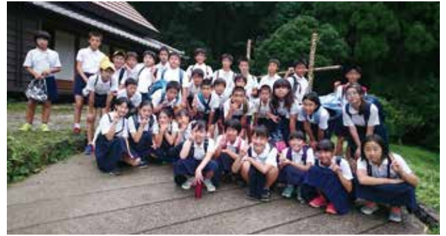
▲竜北西部小学校六年生の生徒たち

氷川の宝、家庭の宝、地域の宝である子どもたちが里地屋敷で学んだことが社会や学校生活の場に役に立つように今後ともしっかり見守りたいものです。