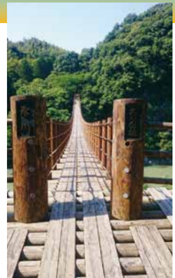
▲洗浄した火の国橋

実施する様子をドローンで撮影し、立神峡の宣伝にもなるので、今後このような取り組みが普及すると経費の大幅節約にもなると思います。この便りが皆さんのお手元に届く頃には火の国橋は新しく化粧直しが完成し、最高の輝きを増していることと思います。