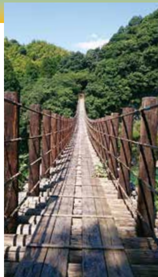
▲洗浄前の火の国橋

火の国橋は建設以来、相当汚れが目立ち、水洗いしてきれいになりましたが、3年もするとまた汚れが目立ってきました。そんな時、熊本市内の塗装業者の社長との出会いから塗料のみで私たちがきれいにしてあげますとの申し出があり、町と協議した結果、お願いすることとなりました。企業の社会的貢献を果たしたいとの強い思いが今回の実現に結び付けることができ、日本名勝である立神峡が益々きれいになり、多くの観光客が訪れるようになれば知名度はもっと上がると思います。この際、塗装を