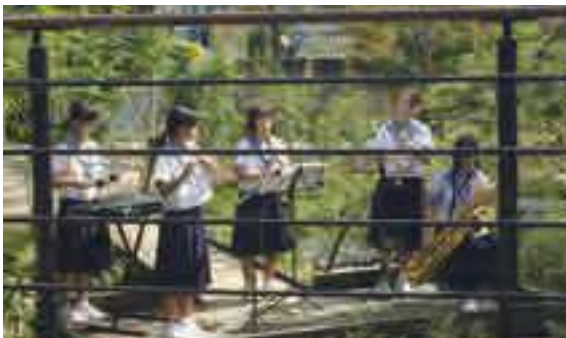
▲コンサートの様子

八火図書館において、竜北中学校吹奏楽部による「八火図書館ミニコンサート」が開催されました。 このミニコンサートは、八火図書館を利用される皆さんに、音楽に親しんでもらうために企画されたものです。 当日は晴天に恵まれ、2年生部員アンサンブルによる「秋のうたメドレー」や「ふるさと」など秋にちなんだ曲がテラスで演奏されました。 来館された方々は、秋空の下、生演奏を楽しまれています。