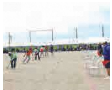
▲秋季大会・総合優勝：有 佐