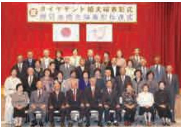
▲金婚式表彰者の皆さま