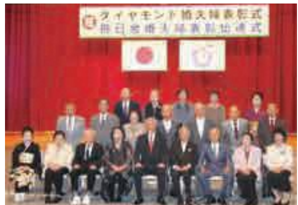
▲ダイヤモンド婚式表彰者の皆さま