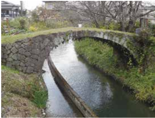
▲郡代御詰所眼鏡橋

す。昭和53年、河川改修によって地形が変わることとなり、埋設されました。そのため、現在では見ることはできません。