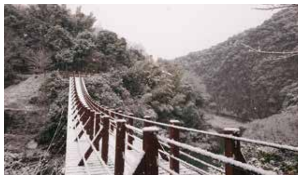
▲美しく雪化粧した立神峡