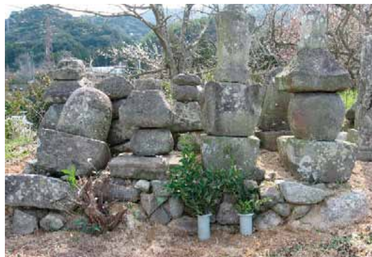
▲町指定有形文化財『おさき墓地・宝塔』