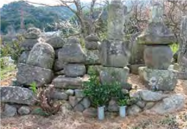
▲町指定有形文化財『おさき墓地・宝塔』