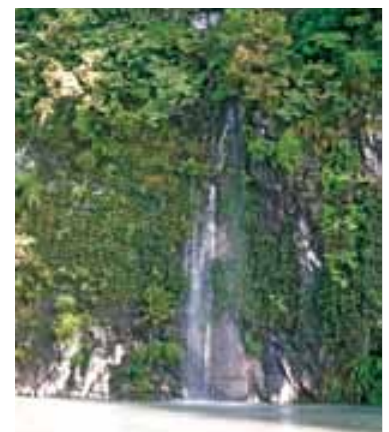
▲美しい景観の幻の滝

しかしそれ以上に不思議なのが、長雨が続いた時などに見られる幻の滝の出現と言えます。断崖絶壁のほぼ中間あたりの川面より約25m付近から、約1週間ほど滝のように水が溢れだし、正に幻の滝が出現するわけです。詳しいことはわかりませんが、大きな空洞が中にあるのではないかととも言われており、その圧倒的な岸壁の迫力にも負けじと勢いよく流れています。今年も梅雨時には見られると思いますので、町民の皆様は是非ともお見逃しの無いようにご紹介致します。