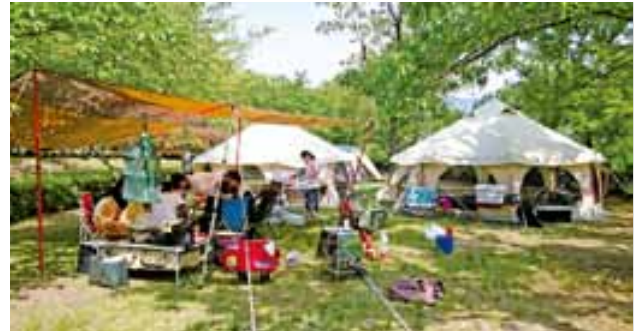
▲キャンプサイトはテントでいっぱいになりました

前半のゴールデンウィークは天候が心配されましたが、ログハウス・ロッジ・キャンプサイトは満員御礼となり、熊本県下96のキャンプサイトや施設の人気度No.1が証明された結果といえます。特にキャンプサイトやバーベキューは溢れんばかりの人で、人気は年々うなぎ登りとなっています。また、来場された人がさらにSNSで発信してくれるのでその輪はどんどん広がりを見せています。