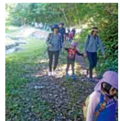
▲森を散歩する常葉保育所の園児たち

毎年この時期になると可愛い園児が森の散歩にやってきます。今年は常葉保育所の園児に加え、河俣保育園の園児も立神峡を訪れて楽しく過ごされました。常葉保育所の5歳児たちは、保護者と一緒に森の中を歩きながら野イチゴを見つけたり、イチゴに似た通称「蛇イチゴ」の見分け方などを教わりながら親子との触れ合いを楽しんでいました。また、一緒にカレー作りにも挑戦し、一生懸命作った美味しいカレーに舌鼓を打っていました。毎年恒例となっている森の散歩ですが、氷川町には他の幼稚園もたくさんあるのでぜひ立神峡公園を利用して頂きたいと思います。恵まれた環境の中、伸び伸びと過ごす園児を見ていると、正に氷川町の将来を担う宝だとつくづく思います。