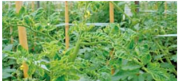
トマト黄化葉巻病

まず、株の上部が黄化し、萎縮してきます。その後芽先の伸びが止まり、着果せず、やがてハウス全体にまん延し、収量は激減します。葉の裏を探すとコナジラミが見られます。