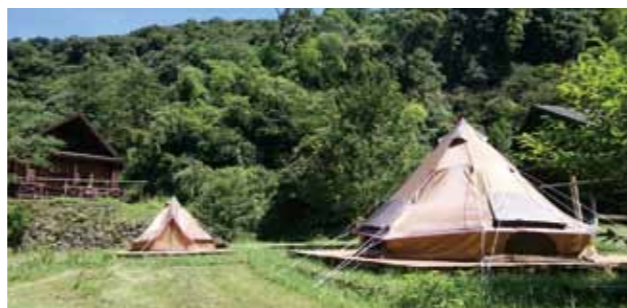
▲大型テントに泊まります！

今まさにアウトドアブームの時代で、全国に550万人のユーザーがおり、その数は年々増えています。そこで、何とか希望に沿うように大型テント(10人用)を2張購入し、いつでも泊まれるようにしていますので、今はやりのグランピング風のテントでこの夏をゆったり優雅なひと時を過ごされてみてはいかがでしょうか。