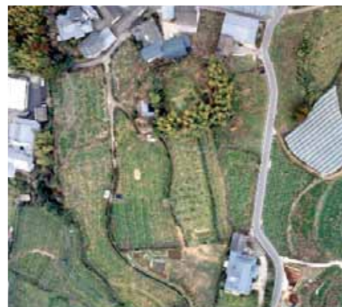
▲大野窟古墳航空写真

大野窟古墳は迫地区の吉野保育園の東側に位置しています。6世紀後半の前方後円墳で、古墳の長さ約123m、県内で最も大きな古墳です。古墳の周りは、溝に囲まれています。戦国時代には石室が開いていたため、古くからその名前は知られていました。石室は複室(部屋が2つある)の横穴式石室で、長さは14