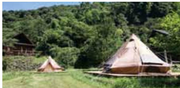
▲大型テントに泊られます！

今まさにアウトドアブームの時代で、全国に550万人のユーザーがおり、その数は年々増えています。そこで、何とか希望に沿うように大型テント(10人用)を2張購入し、いつでも泊まれるようにしていますので、今はやりのグランピング風のテントでこの夏をゆったり優雅なひと時を過ごされてみてはいかがでしょうか。