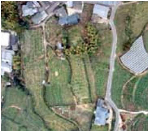
▲大野窟古墳航空写真

このころの古墳は大きさが小さくなる時期であり、100mを超える古墳は珍しいものです。なぜこんな大きな古墳を作ったのか、誰が作らせたのか、謎はまだまだ解決していません。