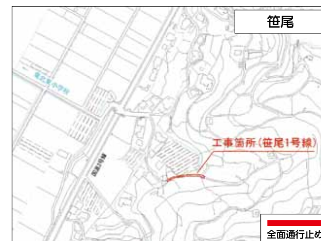
笹尾 工事期間：平成31年3月8日まで