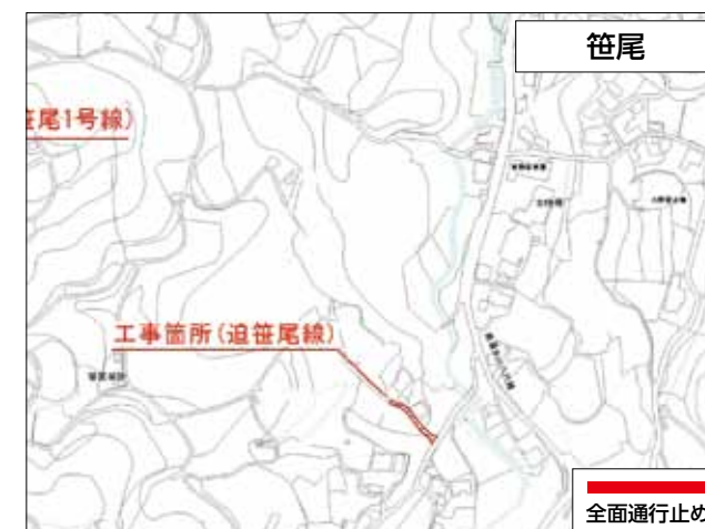
笹尾 工事期間：平成31年3月8日まで