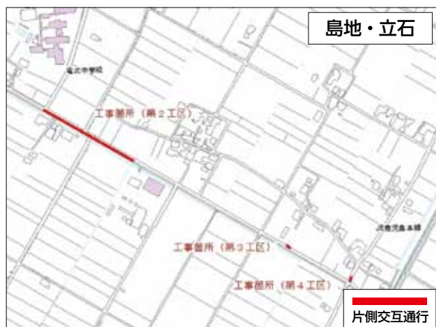
島地・立石 工事期間：平成31年2月22日まで