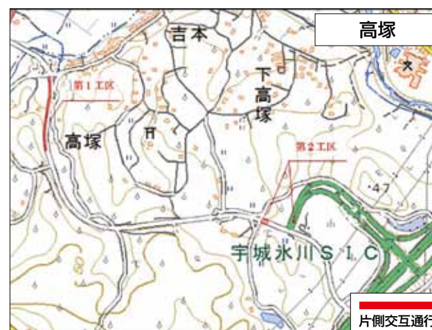
高塚 工事期間：平成31年2月28日まで