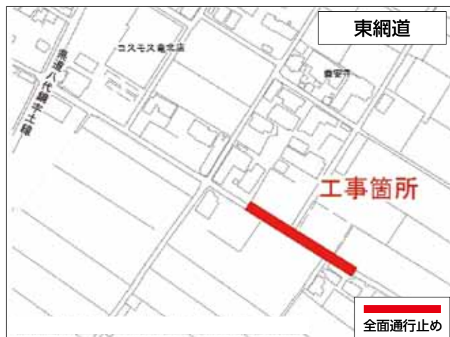
東網道 工事期間：平成31年2月28日まで