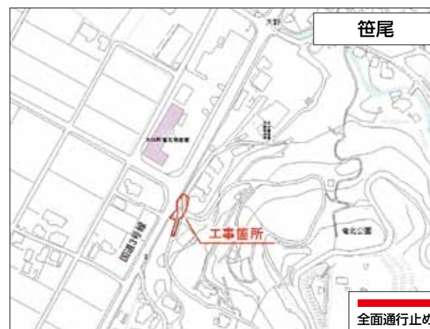
笹尾 工事期間：平成31年3月14日まで

道路工事を行うため、交通規制を行います。近隣住民の皆さまにはご迷惑をお掛けしますが、ご協力をお願いします。