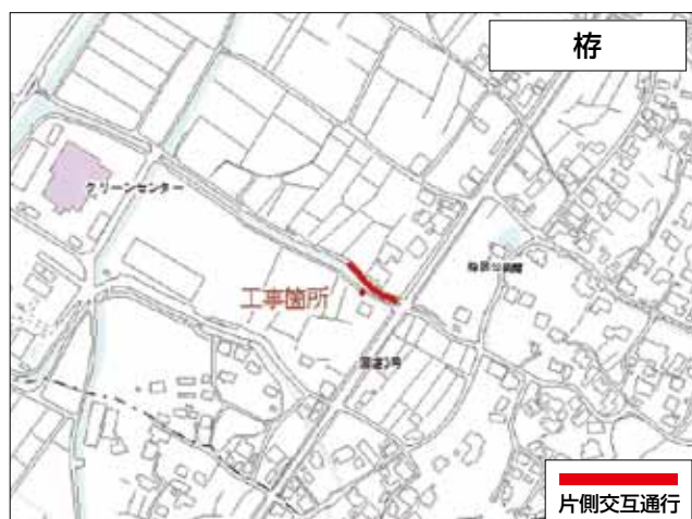
梶 工事期間：平成31年2月20日まで