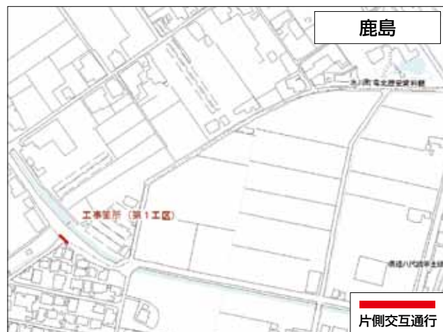
鹿島 工事期間：平成31年2月22日まで