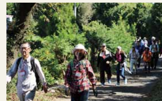
▲元気よく歩きます！