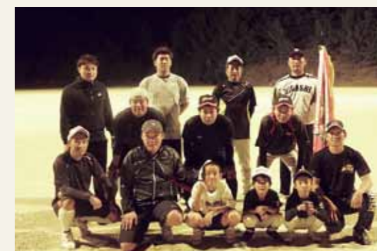
▲優勝した有佐レッズ

序盤は竜西が先行し、有利に試合を進めていきましたが、徐々に有佐レッズが追い上げ、延長の末、8対7と有佐レッズが勝利。今大会では4年ぶり2度目の優勝を飾りました。