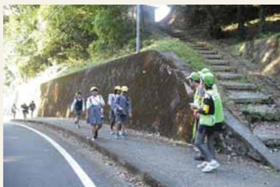
▲毎日子どもたちの下校時間に見守り活動を行います