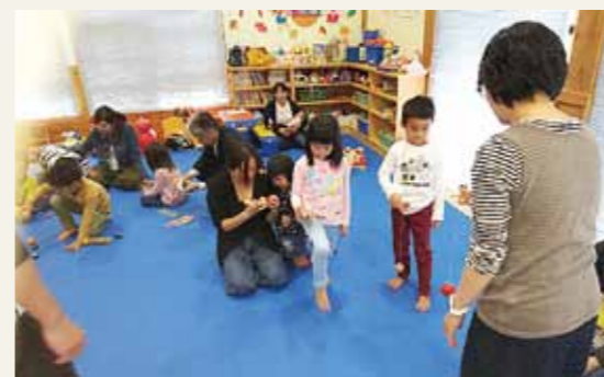
▲上手にできるかな？