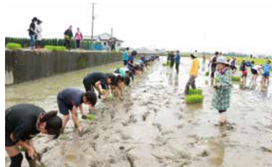
▲きれいに植えることができました