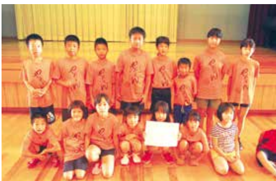
▲低学年の部優勝・町子ども会

各チームが練習の成果を発揮し、予選から1点を争う好ゲームが展開されました。元気いっぱいにボールを追いかける子どもたちの姿に保護者の応援にも熱が入り、笑顔あふれる賑やかな大会となりました。