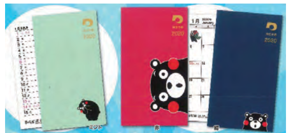
▲色はミント、赤、紺からお選びください