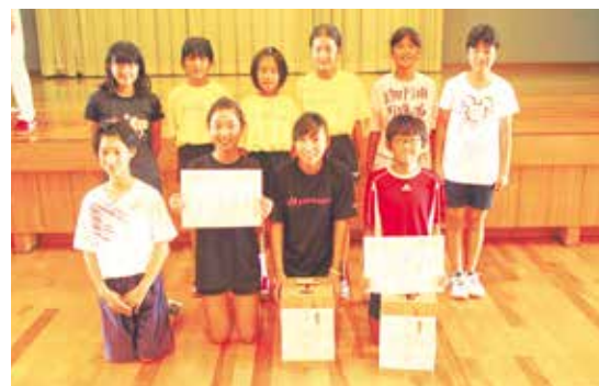
▲高学年の部優勝・下鹿島子ども会