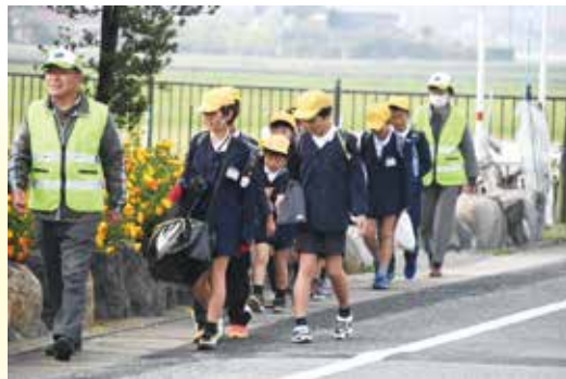
▲竜北東小学校の見守り活動

学校では、地域の皆さまのご協力をいただきながら、児童生徒の登下校時の見守り活動や地区防災訓練などに取り組んでいます。