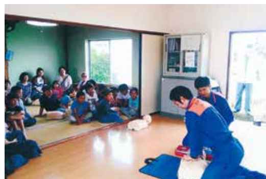
▲地区防災訓練（北野津地区）

防災訓練を通して、災害時の対応と併せて、子どもたちと地域住民がよりよい人間関係を築き、万が一の場合にも、互いに助け合える「共助」の意識が高まることを期待しています。