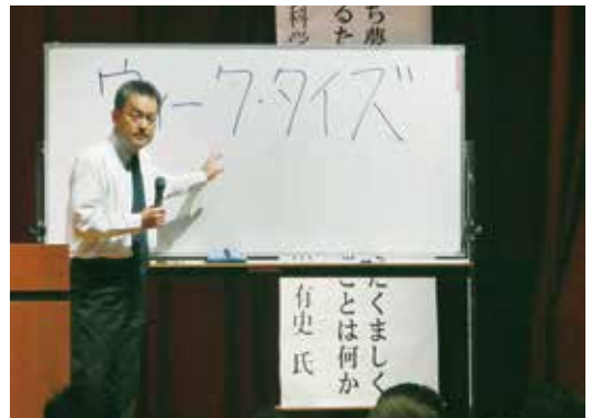
▲東京大学の玄田教授