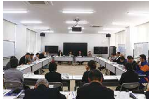
▲総合振興計画審議会の様子

会議では、町の施策に対して20人の委員から多くの意見が出され、取組みの改善に向けた助言などをいただきました。詳細については、町ホームページに掲載しておりますのでご覧ください。