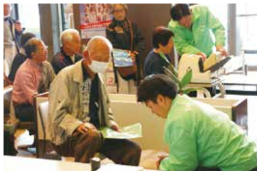
▲血圧血流の測定体験

参加者からは「食生活の見直しや定期健診で自身の体の状態を知ることが大切だ」との声が聞かれました。