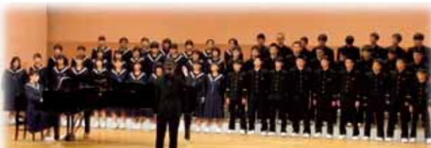
北部音楽祭、3年生合唱。合唱コンクールも見事でした!