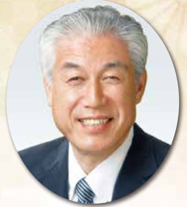
氷川町長 藤本 一 臣