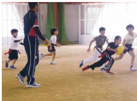
▲タグラグビーをする子どもたち