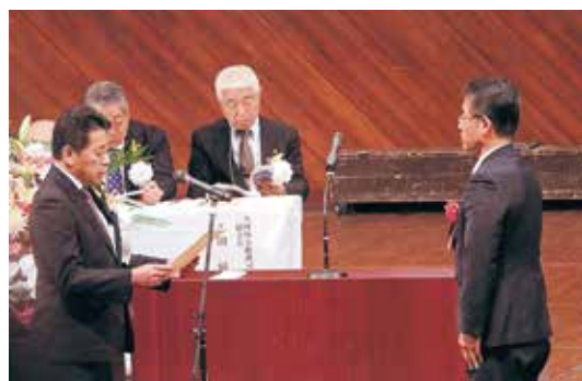
▲表彰を受ける竜北中の横井教頭