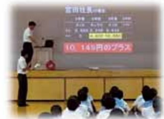
農業講話・八代農業高校