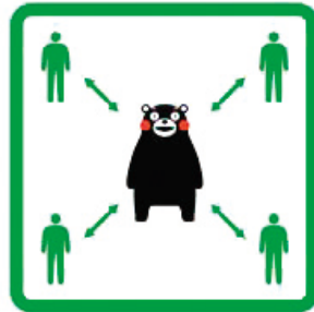
くっつかないモン #KeepDistance