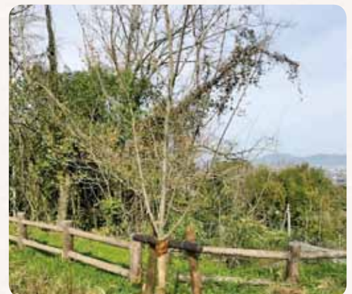
▲桜ヶ丘公園に植樹されたソメイヨシノ

今回は桜ヶ丘公園で開催を予定していましたが、八代地域植樹祭が新型コロナウイルスの影響により中止となったため、記念植樹で植栽予定であったソメイヨシノを事務局で植樹しました。