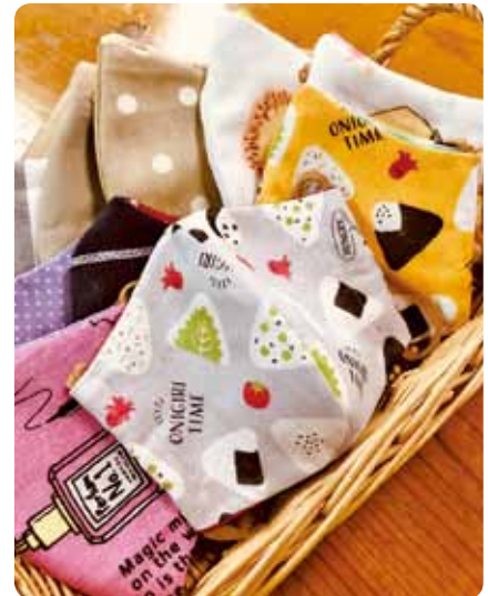
▲マスクの形や柄は異なります