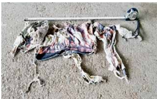
▲ポンプに詰まっていた衣類(吉本地区)