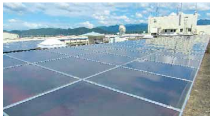
▲太陽光発電設備(役場本庁舎)

地球環境への負荷軽減を目指し、今後も二酸化炭素排出量の削減に取り組んでいきます。