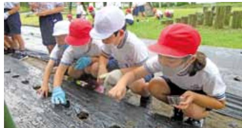
▲みんなで苗植えをしました