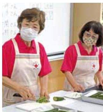
▲婦人会による実演

講師が見守る中、子どもたちは、緊張しながらも一生懸命に切っていました。テストで切ったキュウリはドレッシングなどで和え、おいしく食べました。