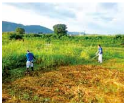
▲氷川流域の清掃活動

町のシンボルである清流氷川の良好な環境を維持し、地域の活性化に寄与するための活動を行う清流氷川流水対策協議会など行政や民間団体、地域住民が一体となって清流氷川の水環境を保全し、豊かにするための取り組みが行われています。