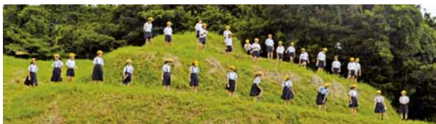
▲古墳はこんなに大きいよ～