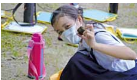
▲埴輪のかけら発見！

こうした学習を通して子どもたちがより深く古墳や町の歴史を学び、氷川町を好きになってくれたらと思います。