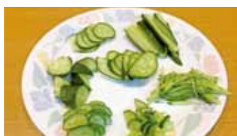
◀7種類の切り方で切ったキュウリ