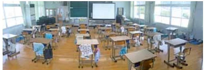
▲音楽室が6年教室に大変身!

6月1日(月)から学校が本格的に再開されました。新型コロナウイルス感染防止対策として、検温を含めた健康観察、マスク着用、石鹸による手洗い、給食配膳での消毒、放課後の教室などの消毒を行っています。いわゆる「3密」を避けるため、広い教室への引っ越しや授業形態の工夫も行っています。