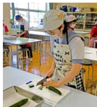
▲教わったことを実践します