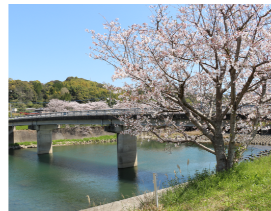
こいこい橋付近の遊歩道に咲く桜

政健全化を見据えた徹底した行政改革に取り組みとともに、国が掲げる新しい資本主義への改革を念頭に置き、氷川町総合振興計画ならびに地方創生総合戦略に基づいたまちづくり戦略を掲げ、議会の協力を頂き、町民の皆さまと協働しながら、「小さなまちで、大きな幸せを感じる田園都市・氷川」の実現に向け、堅実かつ積極的な町政の運営を行ってまいりますので、よろしくお願い申し上げます。