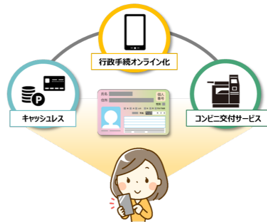
▲スマート行政サービスのイメージ

さらに効率のよい機能的な行政組織とするため、公共施設の管理運営計画に基づき、適正な施設管理を行うとともに、効率的な運用に努めていきます。