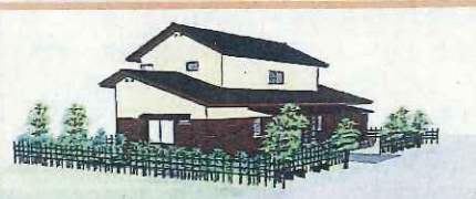
～南棟（一棟2戸）パース図～