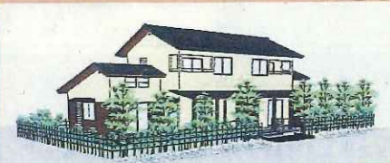
～北棟（一棟2戸）パース図～

この木造戸建賃貸住宅は、宮原らしい住宅のモデルとなるような建築協定に即した1棟2戸型の木造住宅です。