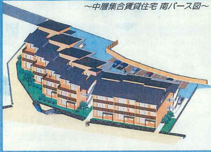
～中層集合賃貸住宅 南パース図～