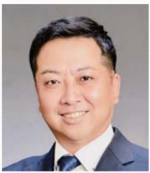
飯田 健二 議員