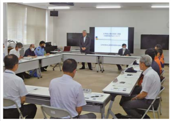
立神峡水難事故防止対策連絡会