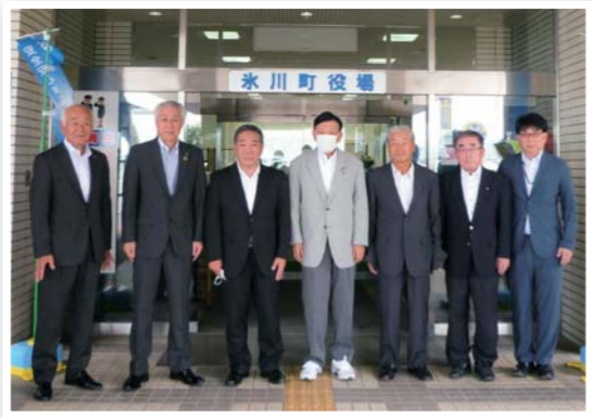
視察研修受け入れ（北海道大空町）