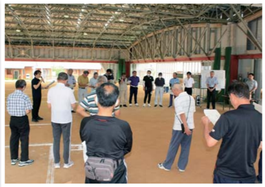
区長会交流会（町内）