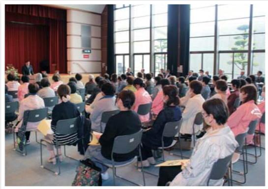
氷川町婦人会総会（町内）