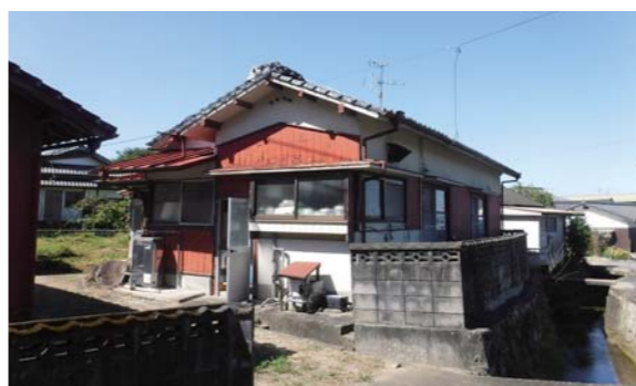
氷川町ホームページ（空き家バンクより）

【議員】 現在、町内で空き家は何件あるのか、またここ近年でどれだけ増えていますか。 【建設下水道課長】 平成28年に139軒だった空き家が現在243軒、近年で100軒以上増加しています。 【議員】 これまで、どのような空き家対策を行ってきたのでしょうか。 【建設下水道課長】 これまで空き家対策として、氷川町空き家バンク事業を実施しておりますが、空き家が増加し続けているのが現状です。