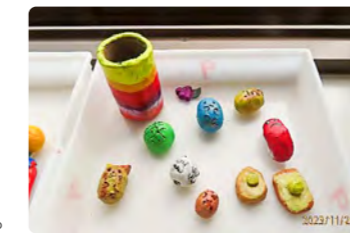
土で鉛筆を入れる筒を作り、色を付けました。