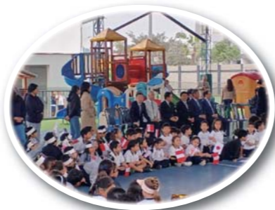
サンホヤ テ モンテリコ学校 (くまモンショー)