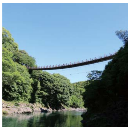
立神峡公園 吊り橋

町長 しっかりと指導をやってきています。ちゃんとしている部分もありますので理解を頂きたい。立神峡は氷川町の財産、地域の宝と思っています。喜んでおられる方の声も聞きます。