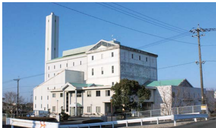
クリーンセンター

農業振興課長 畳表織機の機能強 化・オーバードール・高品質の畳表 に対応できるようにするもので、県 から2分の1の補助があり、1団体 から要望が来ています。