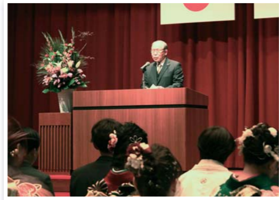
氷川町二十歳の集い