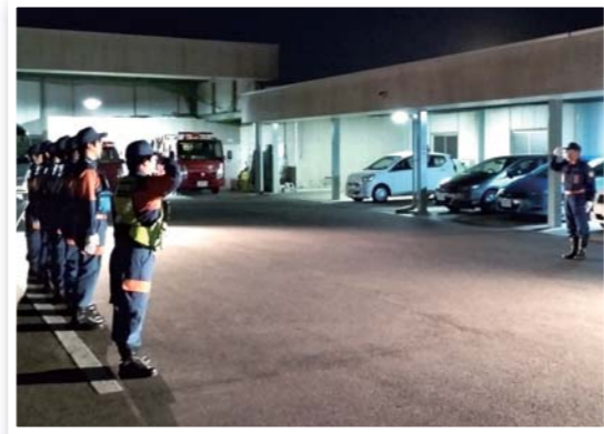
消防団年末警戒激励