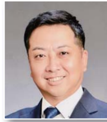
飯田 健二 議員