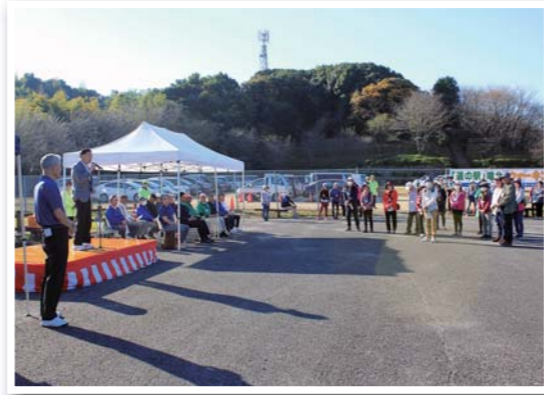
「道の駅」竜北ウォーキング2023