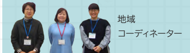
地域 コーディネーター