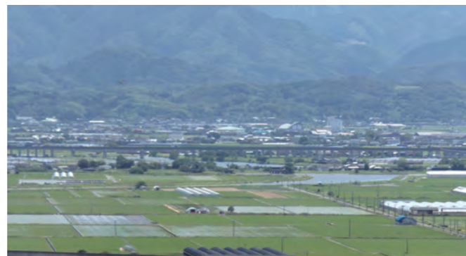
氷川町全景(宇城市不知火より)