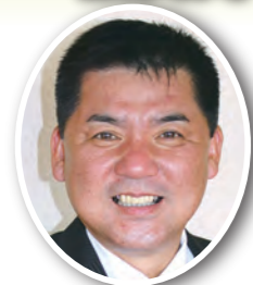
片山 裕治 議員