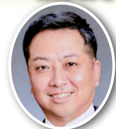
飯田 健二 議員