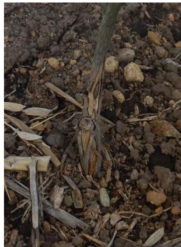
【幹割れ部の拡大図】