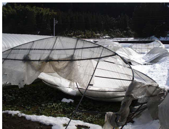
雪下ろしや補強、被覆物の除去などをしないと押しつぶされるようにハウスが倒壊する